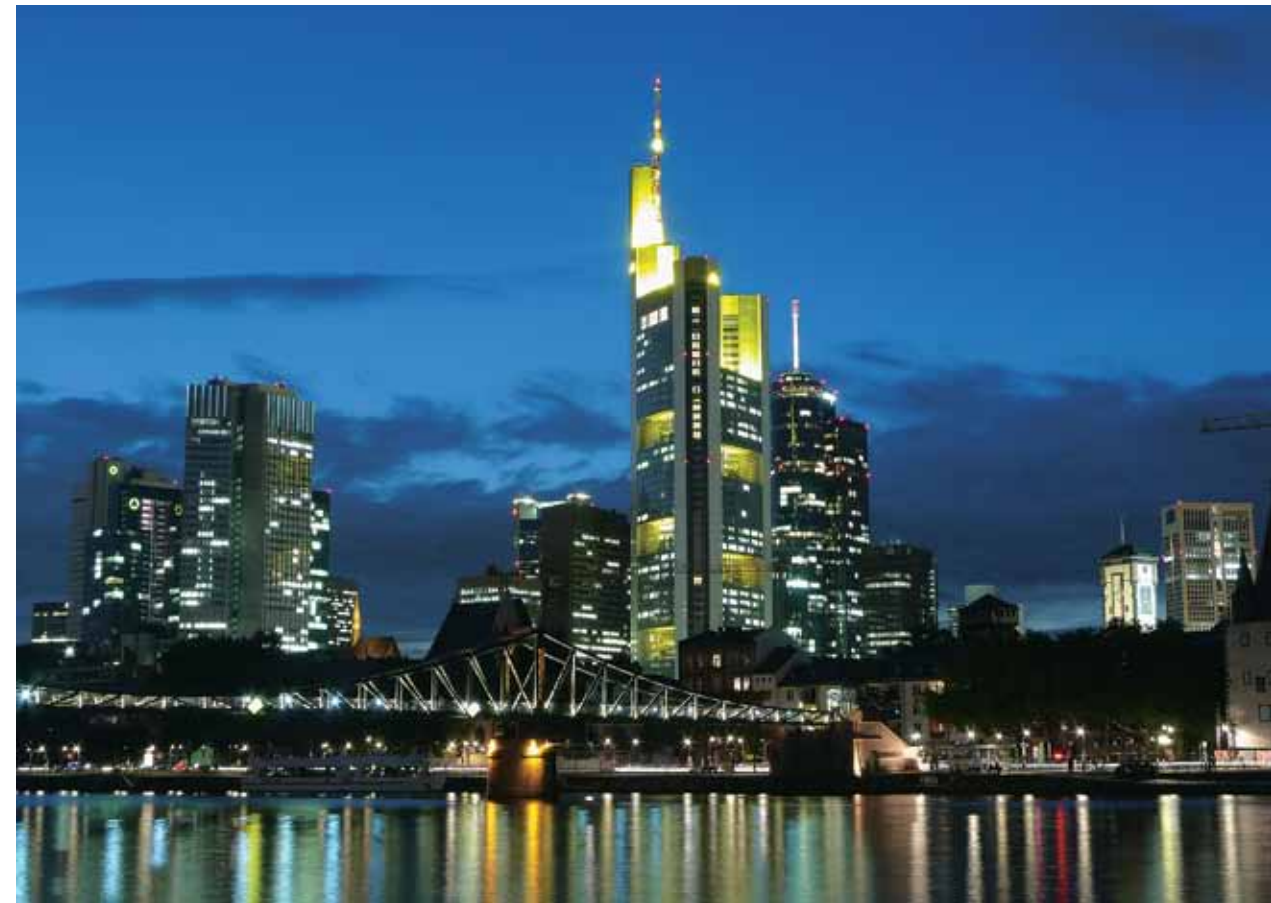
Thomas Emde ›Lichtinstallation‹ 2000, Commerzbank, Neue Mainzer Straße/Gallusstraße

Was Frankfurt als Galerienstandort nachhaltig gescheit hat, ist das Scheitern der Kunstmesse in der Stadt. Nachdem sich über lange Jahre die ›art frankfurt‹ ihren festen Platz im bundesdeutschen Messereigen erobert hatte, machte man den Fehler, sich mit den ganz großen internationalen Handelsplätzen für Kunst messen zu wollen. Das Ergebnis war, dass die Messe mit einem neuen