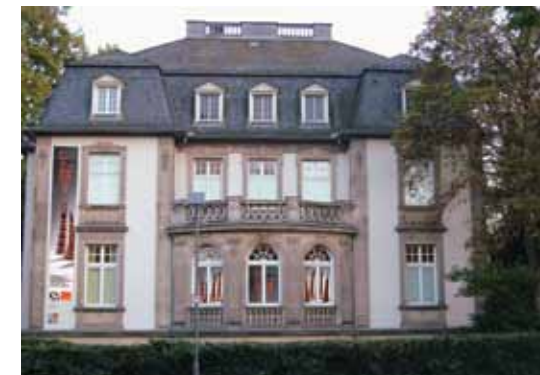
Museum der Weltkulturen · Foto: Heike Schäfer-Kolberg

· Schaumainkai 29 - 37 · www.mdw-frankfurt.de