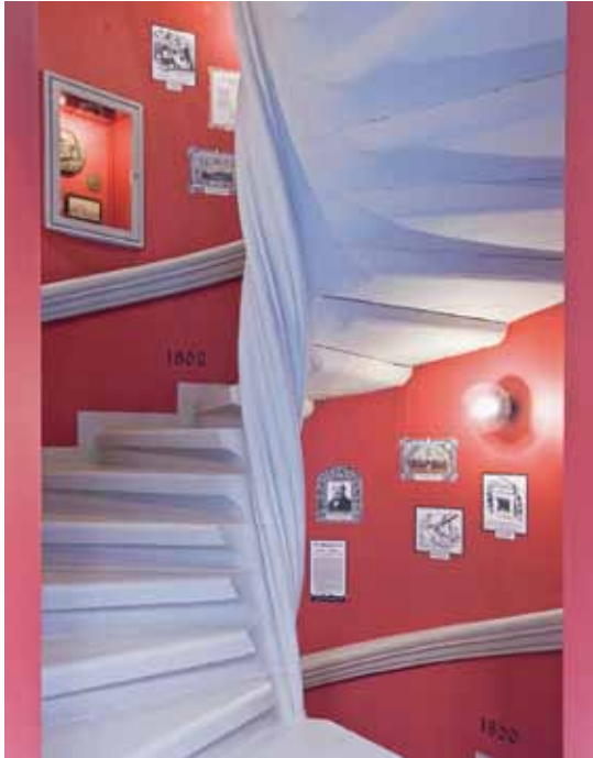
Stoltze-Museum der Frankfurter Sparkasse

andergesetzt. In der 2008 neugestalteten Dauerausstellung und in wechselnden Sonderausstellungen werden Leben und Werk Stoltzes, dessen Biografie eng mit Persönlichkeiten und Ereignissen der deutschen Geschichte im 19. Jahrhundert wie dem Hambacher Fest, der Revolution 1848/49 oder der Reichsgründung 1871 verbunden ist, illustriert. In Veröffentlichungen, Führungen und Lesungen des Stoltze-Museums der Frankfurter Sparkasse werden alle Facetten Friedrich Stoltzes, den Bundespräsident Theodor Heuss in einem Atemzug mit Goethe genannt hat, einer breiteren Öffentlichkeit bekannt gemacht.