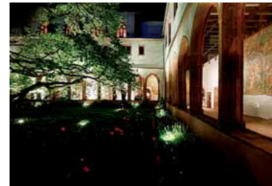
Garten und Kreuzgang des Karmeliterklosters

Das Gedächtnis der Stadt liegt im Institut für Stadtgeschichte/Karmeliterkloster . Im Jahre 1436 ließ der Rat der Stadt ein städtisches Archiv errichten und legte so den Grundstock für das älteste Kommunalarchiv Deutschlands und die älteste kommunale Kultureinrichtung der Stadt