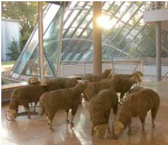
Museum für Kommunikation · Foto: Andreas Haller, MfK, »Telefonschafe« Jean-Luc Cornec , 1989

Im Museum für Kommunikation ist die ganze Welt der Kommunikation zu entdecken. Präsentiert werden Ton-