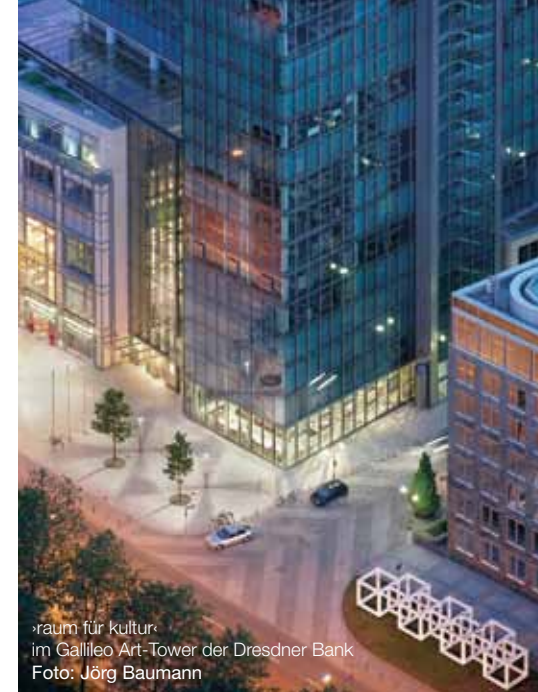
»raum für kultur« im Galileo Art-Tower der Dresdner Bank

und bietet seit 1990 ein »Artist in Residence-Program« an, das den Künftlerausaustausch mit den Partnerstädten Budapest und Salzburg, Helsinki, Seoul, Antwerpen, Strasbourg, Wien und Dubrovnik ermöglicht. Nicht zu vergessen ist das Engagement der Frankfurter Finanzwelt. Da gibt es etwa die Deutsche Börse , die seit 1999 in ihrer »Art Collection Deutsche Börse« zeitgenössische Fotografie sammelt, heute umfasst die Sammlung mehr als 700 überwiegend großformatige Fotografien von rund 70 internationalen Künstlern. Die Werke sind an den Hauptstandorten der Gruppe Deutsche Börse in Frankfurt, Eschborn und Luxemburg zu sehen. Dort finden auch Wechselausstellungen statt, die vor allem jungen Fotokünstlern eine Plattform bieten. Oder die Commerzbank , die immer wieder zu Wechselausstellungen in die Commerzbank-Plaza am Kaiserplatz einlädt. Auch die DZ BANK sammelt seit 1993 Kunst mit dem Schwerpunkt zeitgenössischer Fotografie. Teile der Sammlung werden in regelmäßigen Ausstellungen im eigenen Art Foyer gezeigt. Den »raum für kultur« im Galileo Art-Tower hat die Dresdner Bank , eine