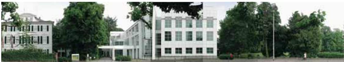
Museum für Angewandte Kunst

Immer neue Projekte werden in Frankfurt angestoßen. In den nächsten Jahren wird am Römer das Historische Museum aus dem Jahr 1972 abgerissen und neu gebaut, nach Plänen des Stuttgarter Architekturbüros Lederer Ragnarsdóttir Oei. Der Neubau soll 2010 begonnen und