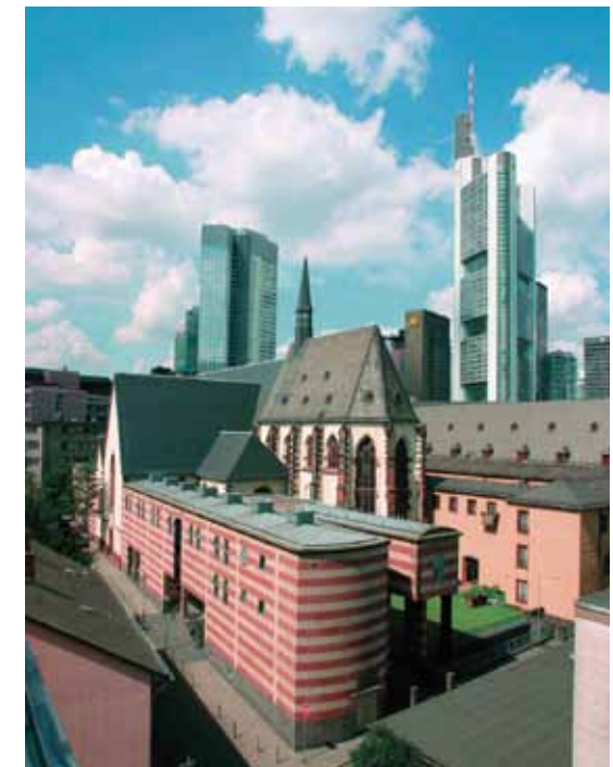
Archäologisches Museum

Sonderausstellungen zu den Kulturen Alt-Europas ergänzen das Angebot des Museums. Der Kreuzgang des Karmeli-