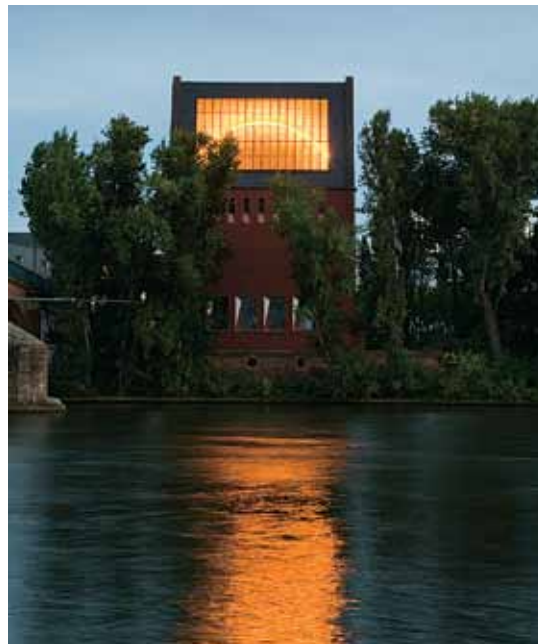
Olafur Eliasson ›Light Lab‹ test 12, Portikus 2008

Ein wichtiges Museum zeitgenössischer Kunst, die Ausstellungshalle Portikus verbindet die beiden Main-Ufer. Es befindet sich auf der Main-Insel an der Alten Brücke und wurde